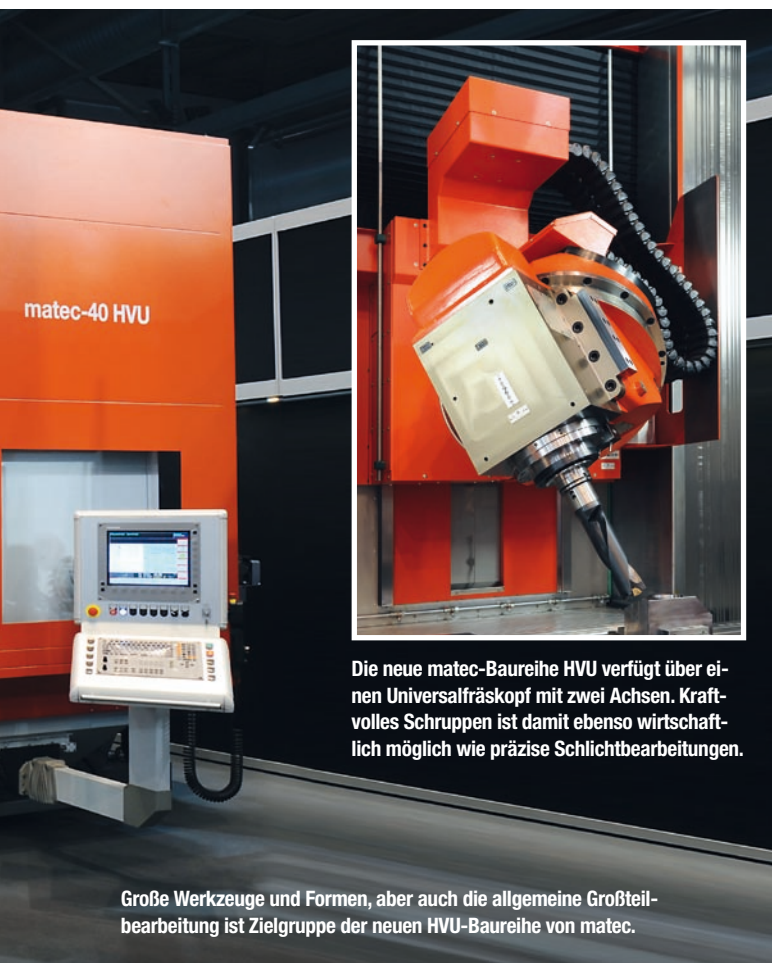
Die neue matec-Baureihe HVU verfügt über einen Universalfräskopf mit zwei Achsen. Kraftvolles Schrumpfen ist damit ebenso wirtschaftlich möglich wie präzise Schlichtbearbeitungen.

Große Werkzeuge und Formen, aber auch die allgemeine Großteilbearbeitung ist Zielgruppe der neuen HVU-Baureihe von matec.